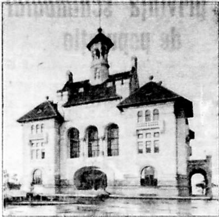
Palatul municipal Constantza

Administrația Centrală a Domeniilor Eforiei Spitalelor civile București